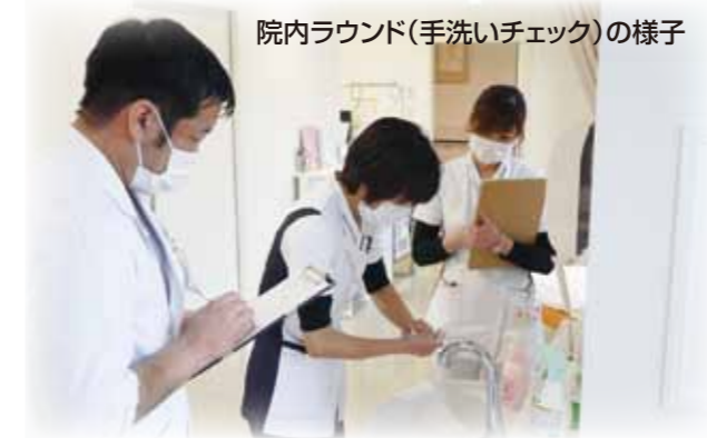
院内ラウンド(手洗いチェック)の様子